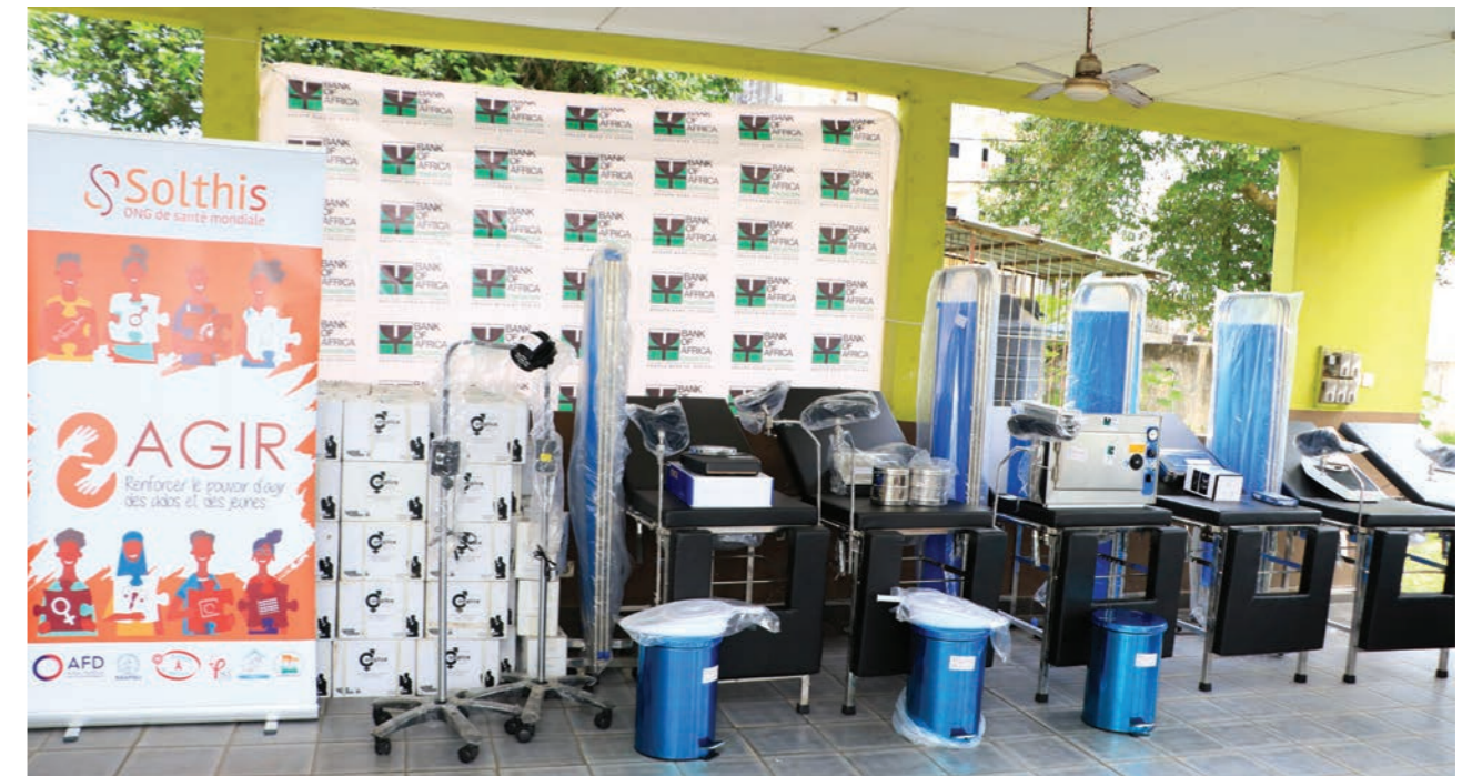
Matériel et équipements médicaux destinés aux structures de santé