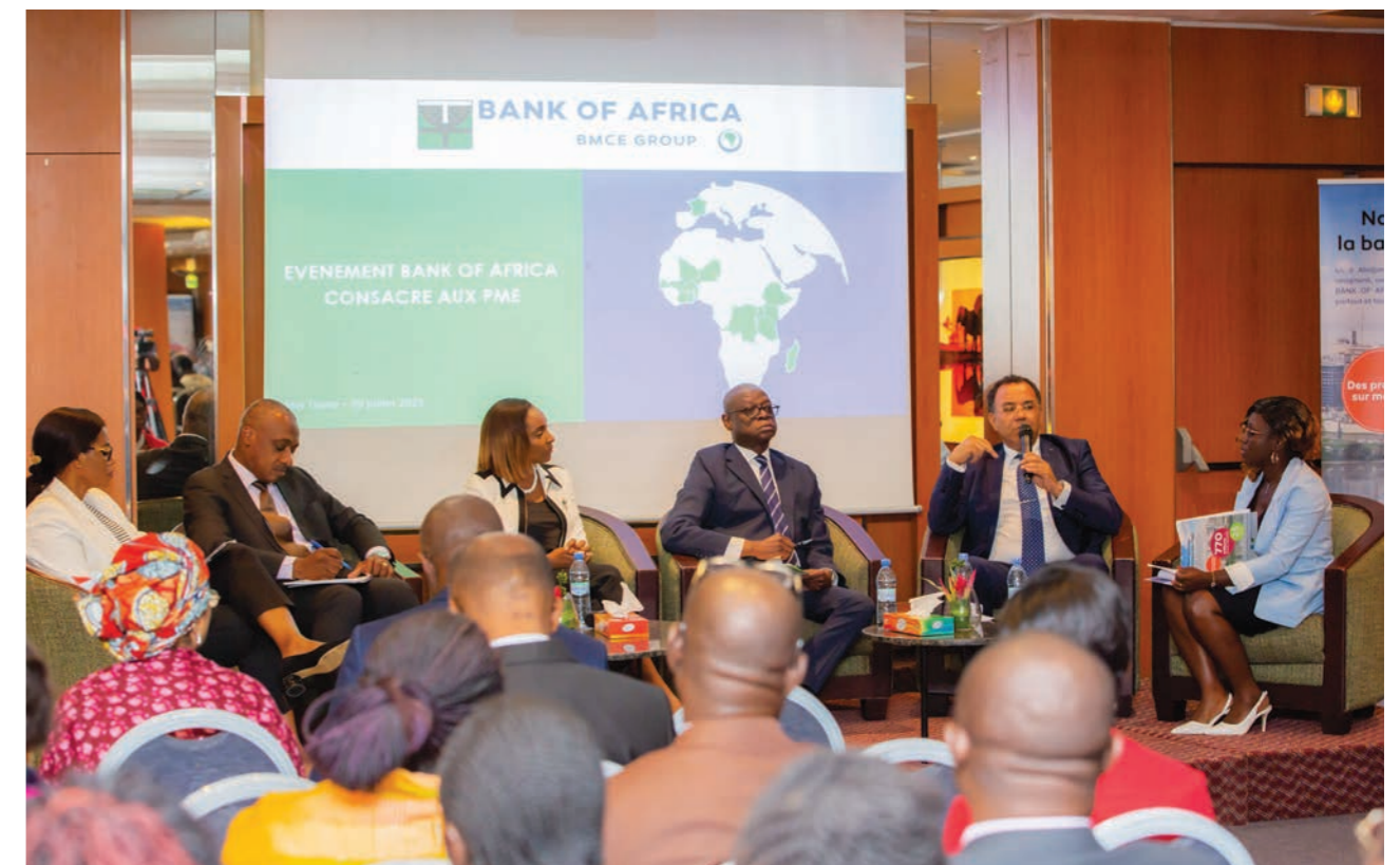
Rencontre BOA - PME